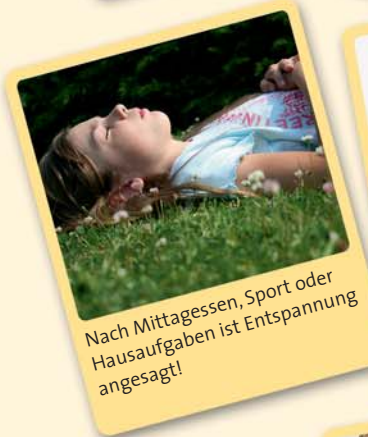
Nach Mittagessen, Sport oder Hausaufgaben ist Entspannung angesagt!