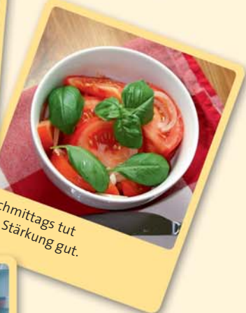
Nachmittags tut eine Stärkung gut.