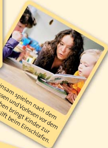
Gemeinsam spielen nach dem Abendessen und Vorlesen vor dem Zubettgehen bringt Kinder zur Ruhe und hilft beim Einschlafen.