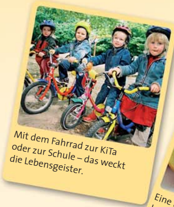
Mit dem Fahrrad zur KiTa oder zur Schule – das weckt die Lebensgeister.