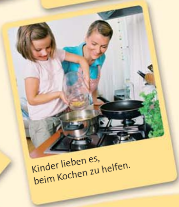
Kinder lieben es, beim Kochen zu helfen.