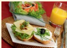
19.00 Uhr Abendessen