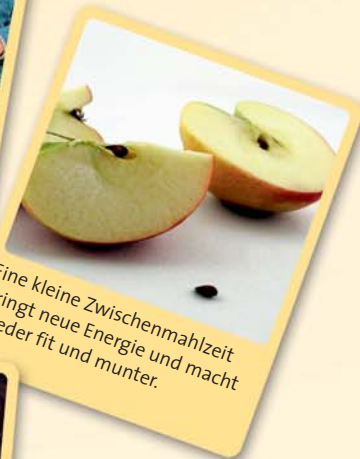
Eine kleine Zwischenmahlzeit bringt neue Energie und macht wieder fit und munter.