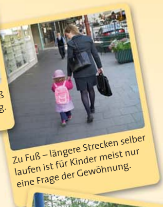
Zu Fuß – längere Strecken selber laufen ist für Kinder meist nur eine Frage der Gewöhnung.