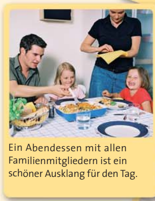
Ein Abendessen mit allen Familienmitgliedern ist ein schöner Ausklang für den Tag.