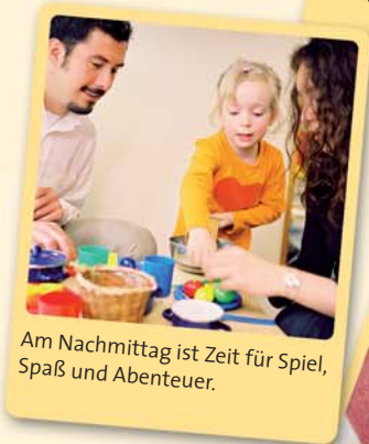
Am Nachmittag ist Zeit für Spiel, Spaß und Abenteuer.