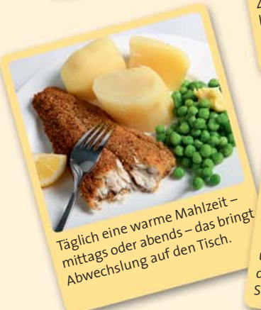
Täglich eine warme Mahlzeit – mittags oder abends – das bringt Abwechslung auf den Tisch.