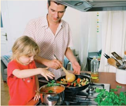
Gemeinsam Kochen macht Spaß – und hinterher schmeckt es noch besser.

Lassen Sie den Abend gemeinsam und entspannt ausklingen, z. B. mit einem Spiel, bei dem alle mitmachen können. Ein kleiner Spaziergang nach dem Essen tut der ganzen Familie gut und lässt auch kleine Rabauken müde werden.