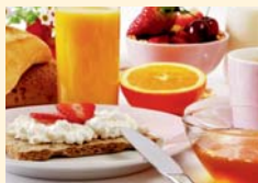
7.00 Uhr Frühstück

Aber auch regelmäßiges und ausreichendes Trinken ist wichtig. Wasser, Saftschorlen, Früchte- oder Kräutertee – zu jeder Mahlzeit und immer wieder zwischendurch – sollten die Grundlage bilden.