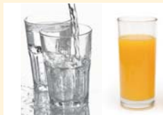
Ausreichendes Trinken ist wichtig.