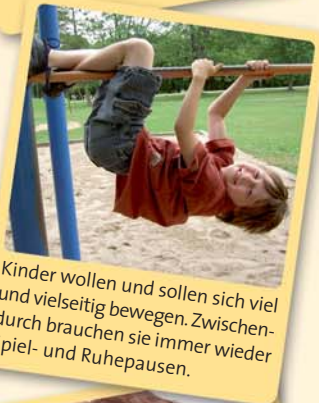
Kinder wollen und sollen sich viel und vielseitig bewegen. Zwischendurch brauchen sie immer wieder Spiel- und Ruhepausen.