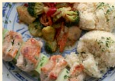
13.00 Uhr Mittagessen