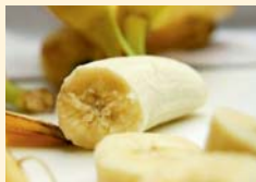
16.00 Uhr Zwischenmahlzeit