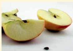
10.00 Uhr Zwischenmahlzeit