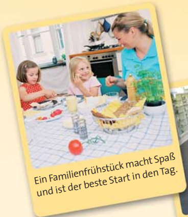
Ein Familienfrühstück macht Spaß und ist der beste Start in den Tag.